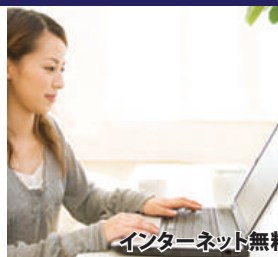
インターネット無料