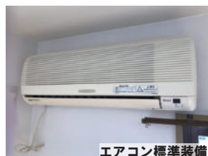
エアコン標準装備