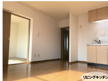
リビングキッチン