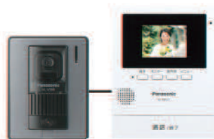
カラーモニターフォン