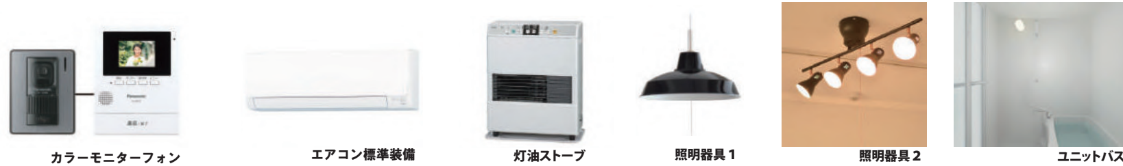
カラーモニターフォン

エアコン&灯油ストーブ&モニターフォンなど充実設備満載!! まずはお問い合わせください!