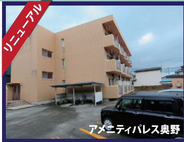
アメニティパレス奥野