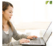
インターネット無料

最初からついていてうれしいものは、やっぱりエアコン! 引越しの時、設置する手間がないので負担が1つ減ります。