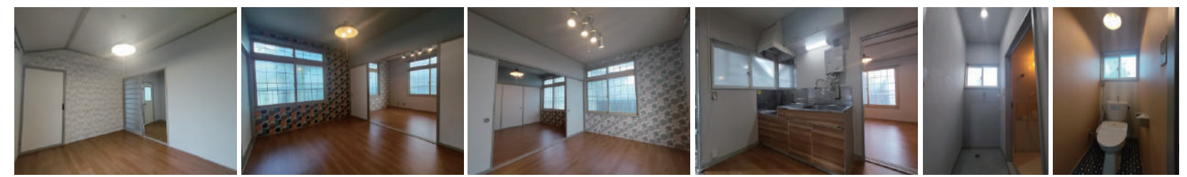
洋室1 洋室2 洋室3 キッチン 洗面脱衣所 WC

▶▶▶ お問い合わせは今すぐこちらまで! ◀◀◀ 保証人、家賃、敷金、希望設備など… まずはどんなことでも要望をお伝えください!