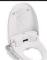
温水洗浄暖房便座