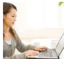
インターネット無料(有線)